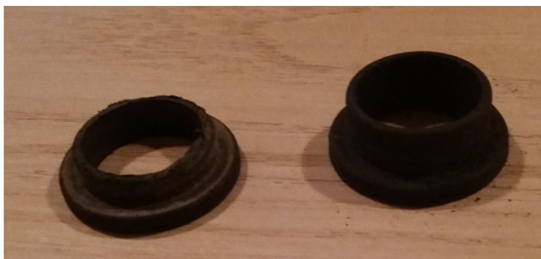
Bague téflon usée.